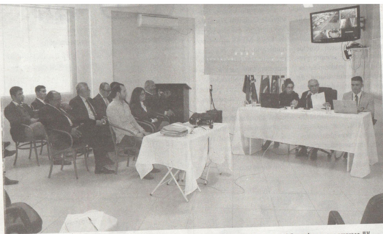
RELATÓRIO mostrou ao Conselho da OAB, inclusive, "erros grosseiros de cálculo na planilha de quilômetro rodado" para favorecer a empresa JLV